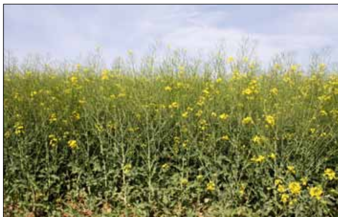
Anniston vo fáze odkvitania, 3.5.2018, lokalita Borovce.

hostiteľských rastlín) pozitívne vplyvávajú na rozvoj tohto vírusového ochorenia. Pri našej hybridnej repke ANNISTON máte tieto faktory vyriešené!